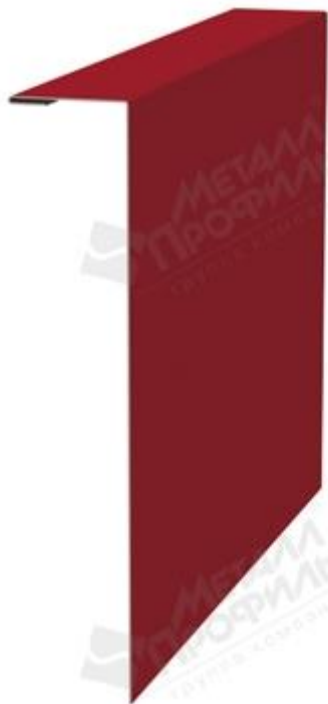
Фасонное изделие для Софит «Лбрус-15x240» перфорированный.