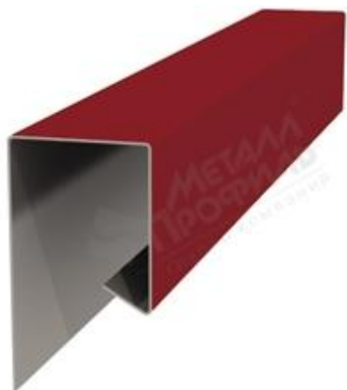
Планка завершающая сложная (ПЗС-30х25х300)

Монтаж начинается от стены дома, установкой планки завершающей сложной (ПЗС-30х25х300) или планки угла внутреннего (ПУВ-30х30х3000), в которую вставляют Софит «Лбрус-15х240» перфорированный. Фиксируют софит, прикрепив к карнизной доске фасонным изделием. В местах примыкания софитов на углах здания монтаж ведется с помощью планки стыковочной сложной (ПСТС-75х3000).