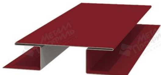
Планка стыковочная сложная (ПСТС-75х3000).