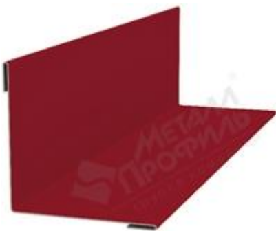
Планка угла внутреннего (ПУВ-30x30x3000).